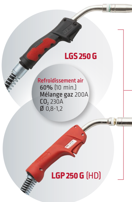
LGS 250 G

Refroidissement air 60% (10 min.) Mélange gaz 200A CO 2 230A Ø 0,8-1,2